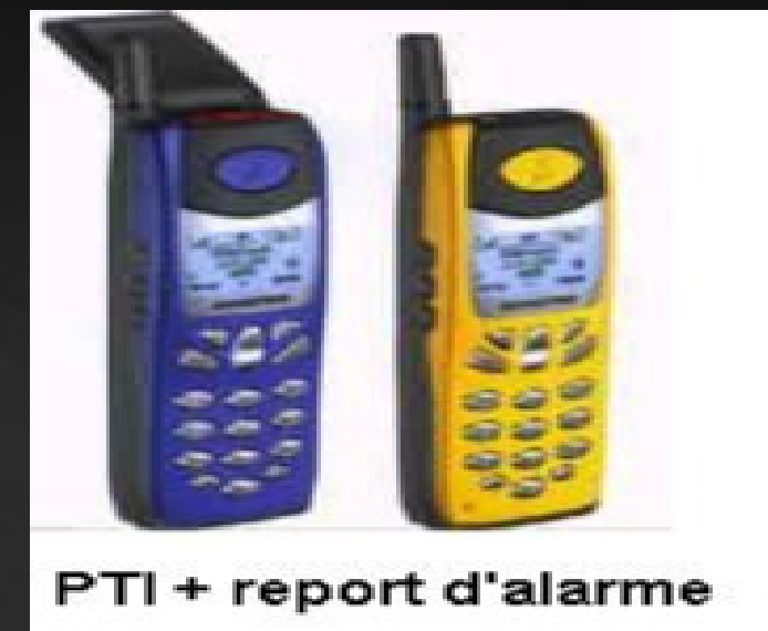
PTI + report d'alarme