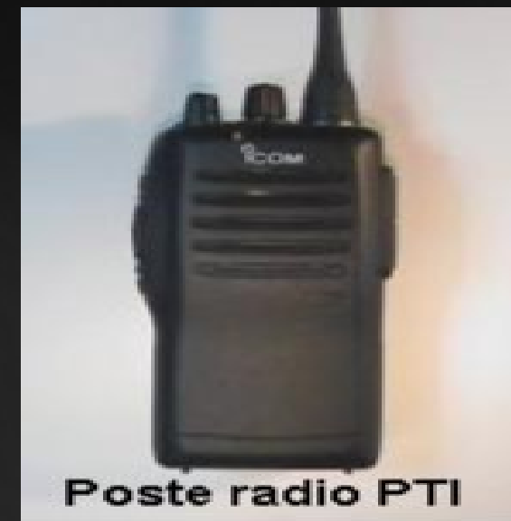
Poste radio PTI